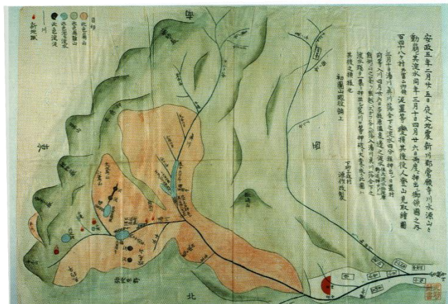
大地震非常変損之図 (加藤文書, 28×39, 彩色) カルデラ付近の土砂移動状況と天然ダムの規模が描かれている (本書 図9.10)

その後の地震や雪解け水や大雨などの増水よりそのせき止められたダムは4月と6月に決壊し、常願寺川下流に大きな被害を与えた。