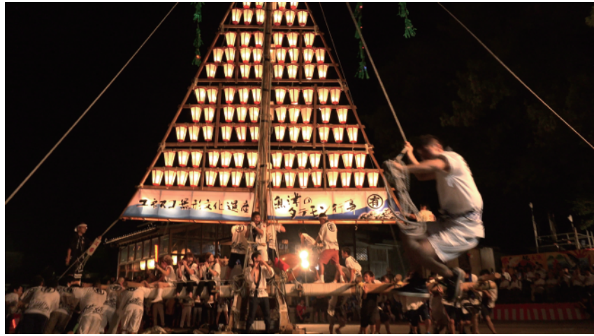
魚津のタテモン行事

毎年8月第1金曜・土曜日の夜に、魚津市の海岸沿いの諏訪町に鎮座する諏訪神社で、豊漁と航海安全を祈願する「たてもん祭り」が行われます。祭りでは、車輪のないそり形の台の中央に高さ15m程度の柱を立て、そこに約70～90個の提灯を三角形に飾りつけた「たてもん」と呼ばれている7基の曳山が、神社前の海岸沿いの道路や神社の境内で威勢よく曳き廻され、奉納されます。現在、諏訪神社前の海岸沿いは道路になっていますが、かつては石ころと砂からなる砂礫浜が続いていました。「たてもん」に車輪がないのはこの砂礫浜を曳いていたためといわれています。この祭りは「魚津のタテモン行事」として国の重要無形民俗文化財に指定され、「山・鉾・屋台行事」33件中の1件として、ユネスコ無形文化遺産に登録されています。