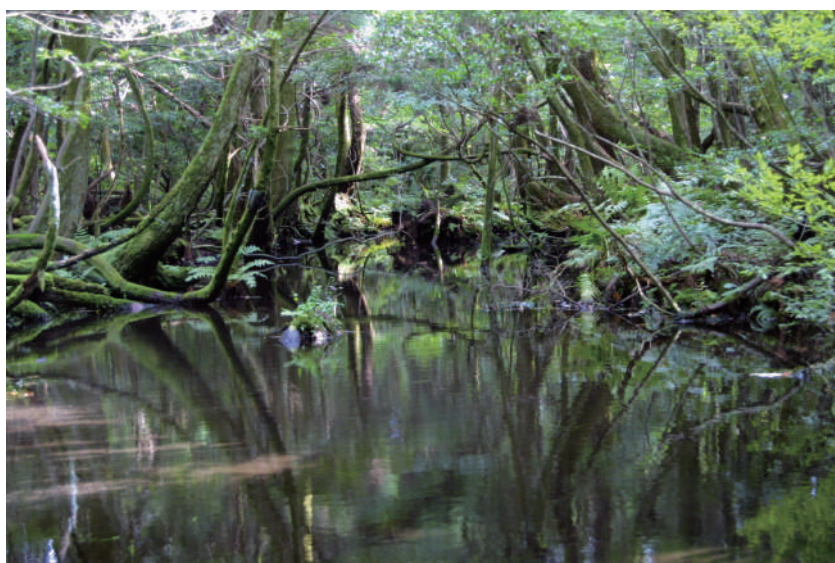
杉沢の沢スギ (入善町吉原)

杉沢の沢スギは、黒部川扇状地の旧河道の湧水帯に生育するスギ林です。礫が多く栄養の少ない場所に根を張るため、山間部のスギに比べて幹が太くなりやすく、年輪が細かいことが特徴です。林内には、スギの他にも湿地性・山地性・暖地性の植物が生育しています。沢スギは、スギの木を建材に利用したり、スギの枝葉を燃料に利用したりされていたため、人の手によって守り育てられてきました。しかし、昭和の圃場整備事業によってそのほとんどが水田に姿を変え、現在は入善町の吉原周辺に2.67haの面積を残すのみとなっています。杉沢の沢スギは、黒部川扇状地の原風景を今に残す貴重な場所なのです。